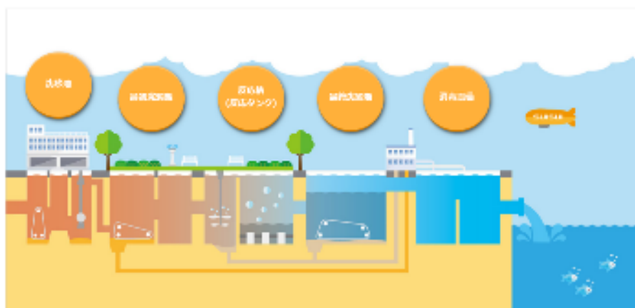
図 1 下水処理の仕組み